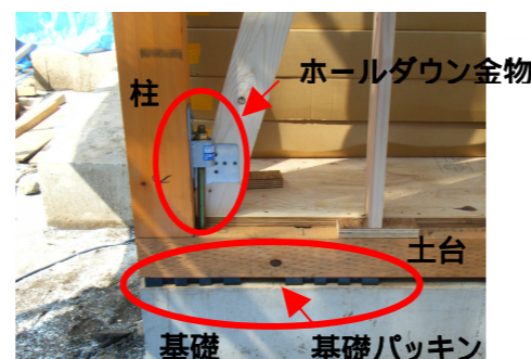
イメージパースです。 (本物件には、一部植栽・車は含まれておりません。)

柱を直接コンクリート基礎に緊結するための接合金物です。地震の揺れによって、建物の柱が土台から引き抜かれるのを防止します。1階では基礎・土台・柱、2階では上下階の柱と柱、又は柱と梁に取り付ける、耐震性を確保する重要な補強金物です。